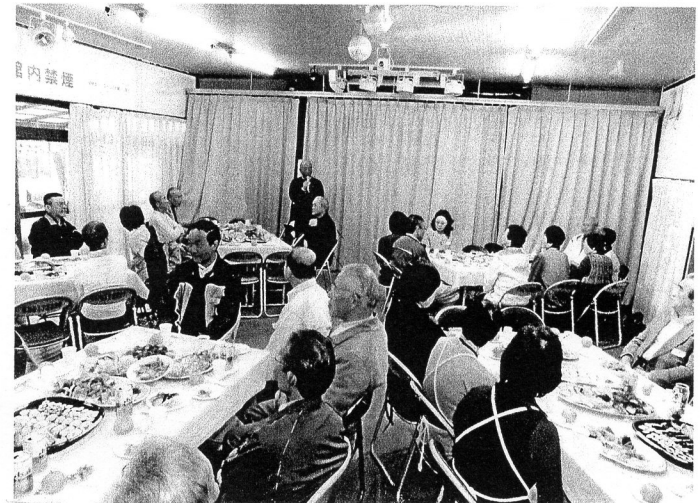
和気あいあいの「会員交流会」風景

毎年恒例の「会員交流会」が、去る十月二十五日(日)に東初石二丁目自治会館で盛大に行われました。当日は、約五〇名の会員が集い、事務所の女性の皆さんの手づくり料理に舌つづみを打ちながら、和気あいあいに歓談し、楽しいひとときを過ごしました。 また、一分間スピーチでは、日頃の活動のエピソードや活動に参加した感想が述べられました。 その中で、多くの会員から「この活動がやりがいになっている」などの発言が相次ぎ、発起人の一人として、この活動を始めて本当によかったと改めて感じました。